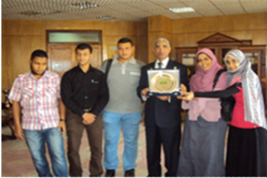
مسابقة حفظ القرآن الكريم والثقافة الإسلامية والأربعين حديث النووية بجامعة المنوفية