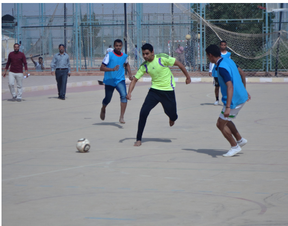
دوري بين كليات الجامعة في خماسيات كرة القدم