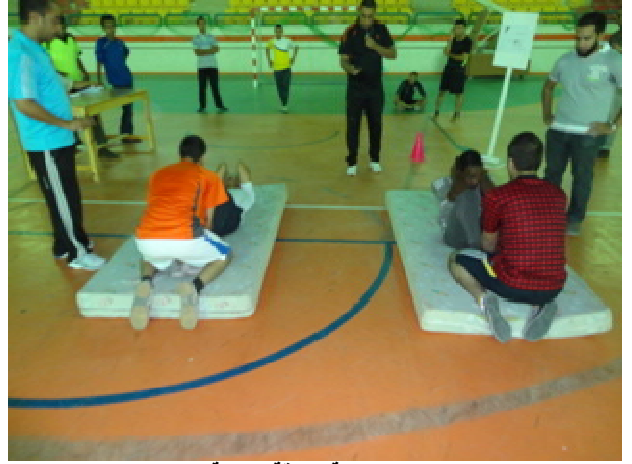
مسابقة اللياقة البدنية