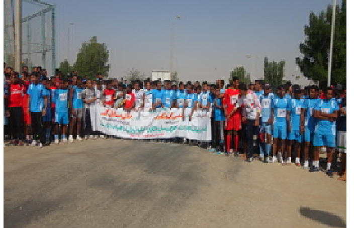
سباق الطريق بين كليات الجامعة