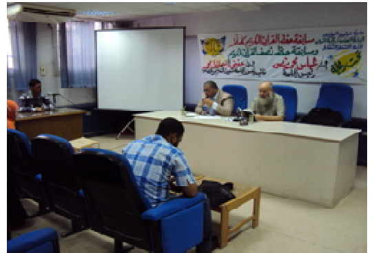
مسابقة حفظ القرآن الكريم