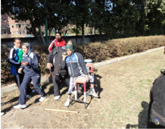
اللقاء الرياضي لذوي الاحتياجات الخاصة لطلبة الجامعات المصرية