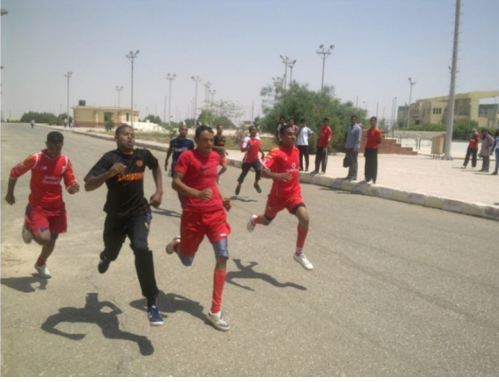
مسابقة بطولة ألعاب القوى (مراكز التعليم)