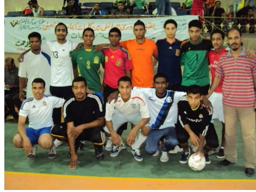
دوري كليات الجامعة في الأنشطة الرياضية المختلفة