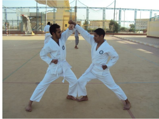
مراكز تعليم كاراتيه