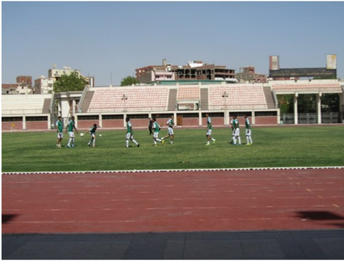
دورة أبطال الجامعات في كرة القدم