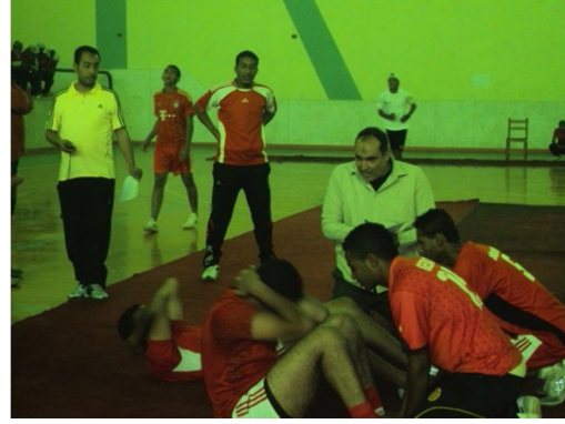
مسابقة اللياقة البدنية