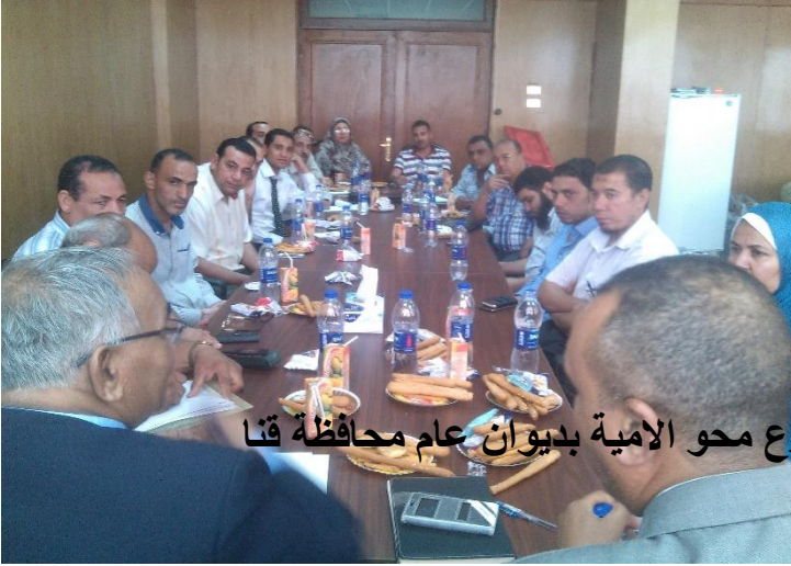
اجتماع الجهات الشريكة فى مشروع محو الامية بديوان عام محافظة قنا